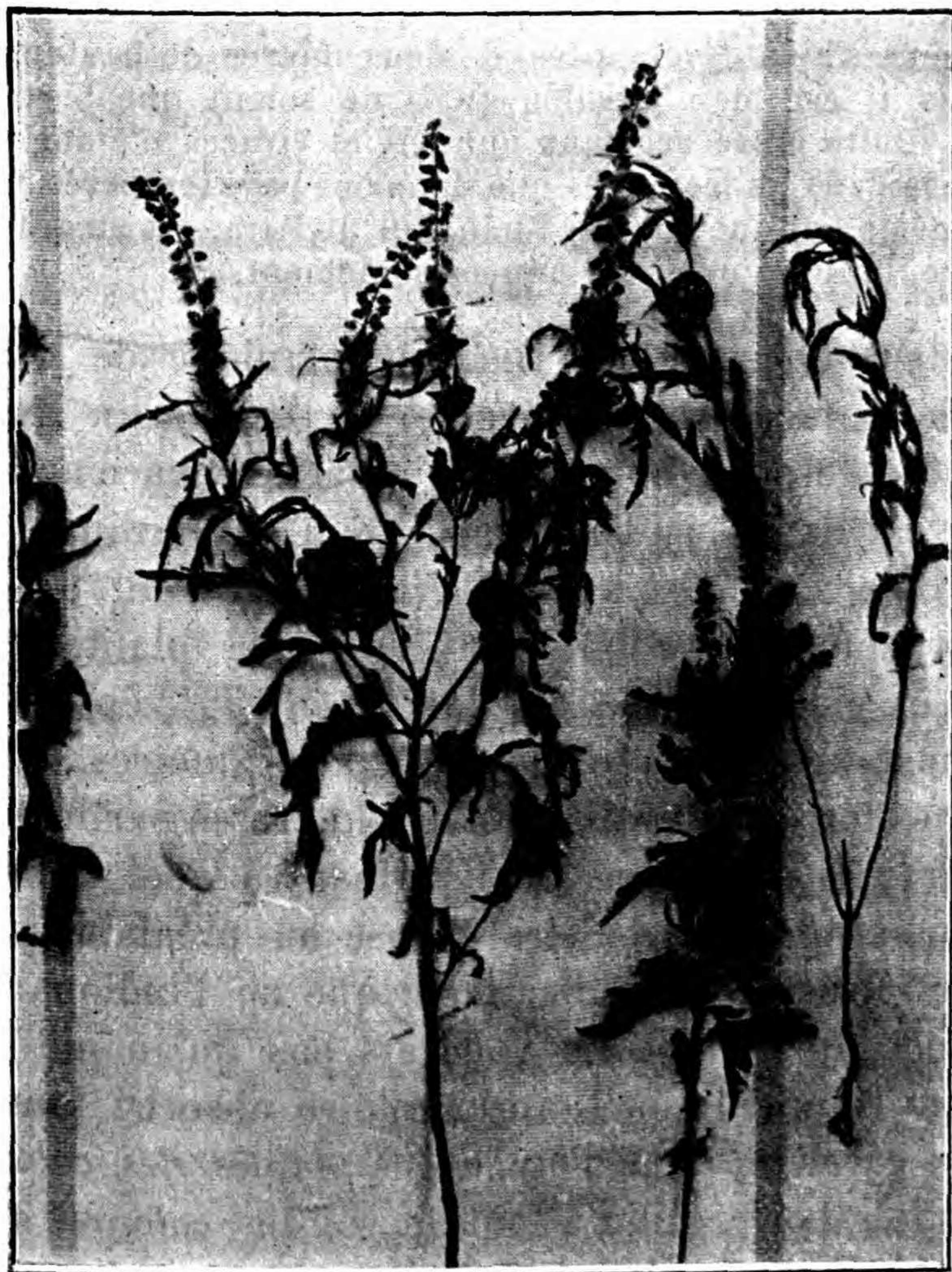
Fig. 4. — Quelques spécimens en herbier de la plante de Challes.